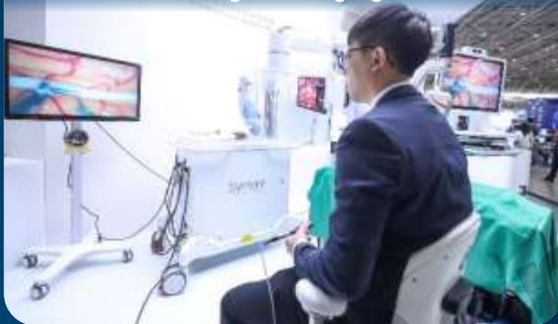
3D Microsurgical Imaging Solution